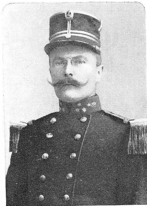
LIBOIS, Emile, né le 13 février 1865, à Wespelaer.

Major. Ordre Léop.; Ordre Cour.; Croix de Guerre; Croix Milit. 2 e cl. Blessé une première fois à Oudstuyvenskerke, le 24 octobre 1914, trouva la mort des braves, à Passchendaele, le 28 septembre 1918, en commandant l'assaut héroïque de la Crête des Flandres.